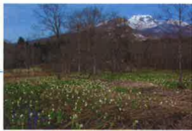
いもり池のミズバショウ (見頃4月下旬~5月初旬)