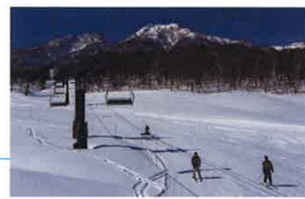
しらかばカプセルリフト