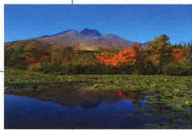
妙高山の紅葉 (見頃10月中旬~11月初旬)